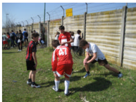
Esercizi di preparazione