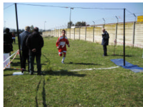
Una fase della gara